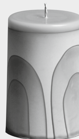
Samt Velours Velvet