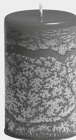
Eiskristall Cristaux de glace Ice crystal